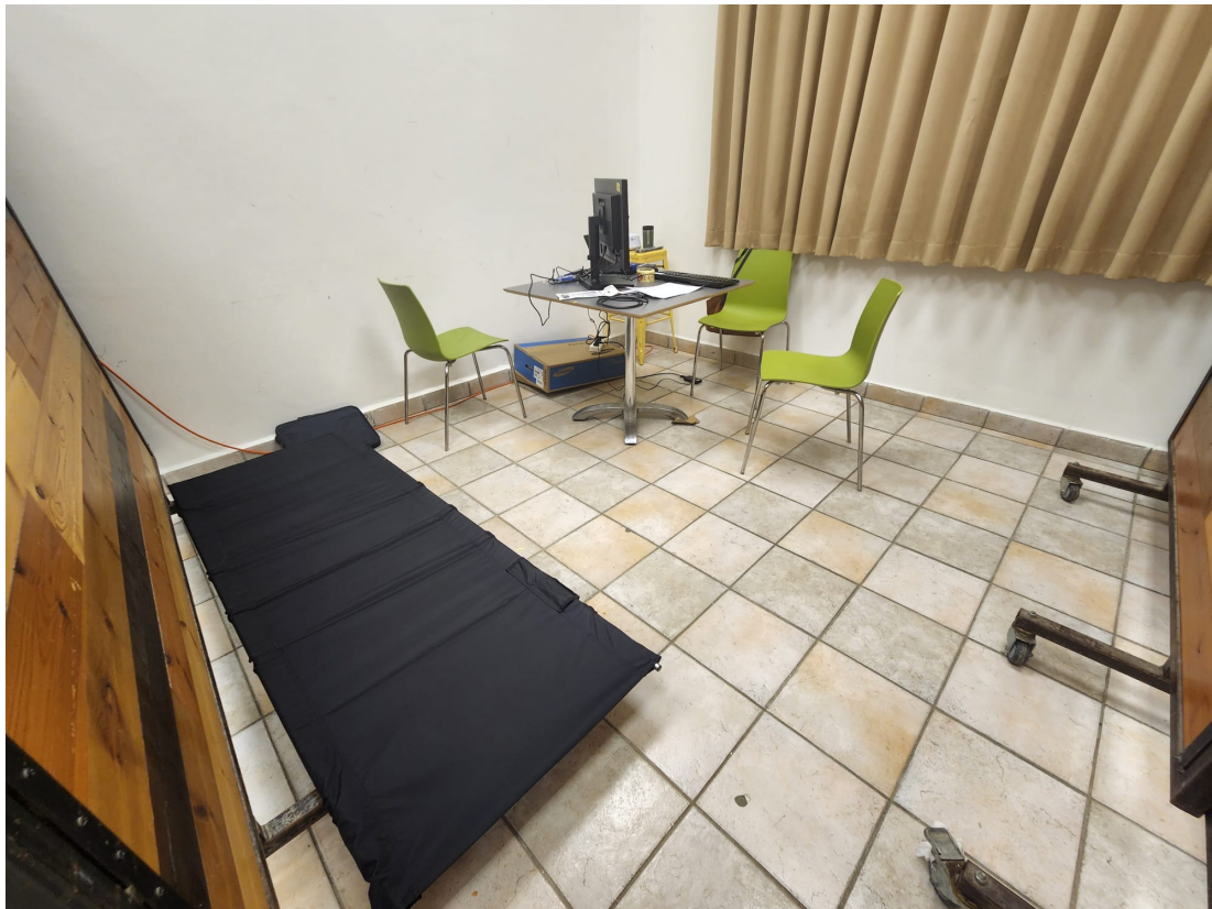
חדר המרפאה לתושבי קיבוץ כפר עזה בקיבוץ שפיים