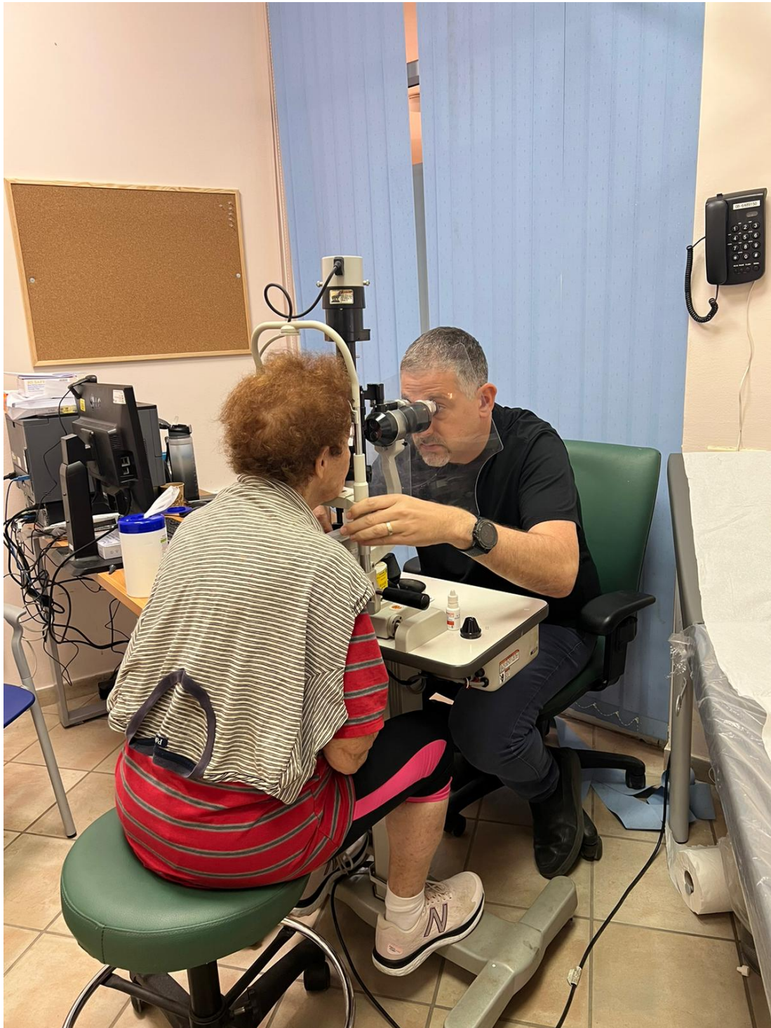
מרפאה של קופת חולים כללית לתושבים שפנו מיישובי עוטף עזה במלון בים המלח

מבחינתו, המימד הרפואי והנפשי אינם ניתנים לניתוק. "בתור רופאי משפחה, אנחנו עוסקים ביום יום במשברים אישיים. גם בשגרה, אם מגיע מטופל עם כאב בחזה אני צריך לברר עם מדובר בבעיה לבבית, בהתקף חרדה או בבעיה אחרת. אני לא מאמין בהפרדה בין גוף לנפש, זה אותו בן אדם, והרבה פעמים הבעיות הן משולבות."