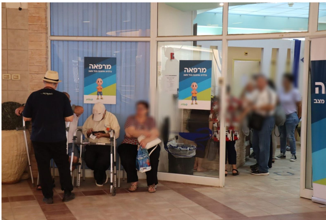
מרפאה של קופת חולים כללית לתושבים שפוננו מיישובי עוטף עזה במלון בים המלח